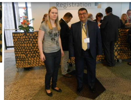
Setkání AriDu s Úřadem průmyslového vlastnictví ČR